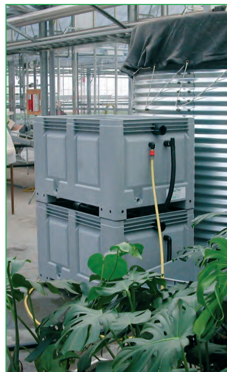
BioBox™ upptar endast golvytan 80 x 120 cm. Flera boxar kan kopplas parallellt. Vattentankar tillkommer.